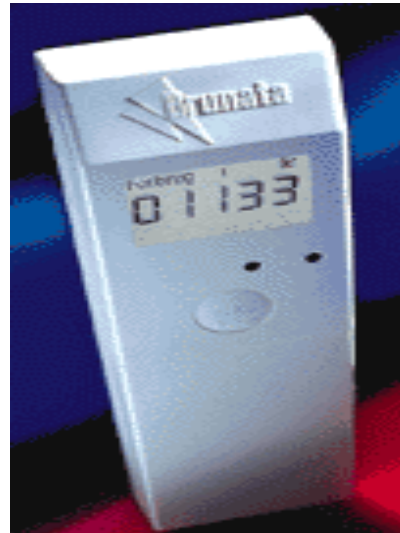
BRUNATA RME 95